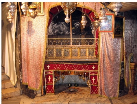
Алтарь Рождества Христова и пещера Рождества

храма, в которой и помещается собственно храм над пещерой Рождества Христова. В эту часть храма ведут три двери. Она представляет собственно продолжение среднего корабля, пересекаемого поперечным. Оба эти корабля образуют форму латинского креста. В четырех углах их пересечения находятся четыре пилястра. В абсиде главного среднего корабля расположен греческий алтарь и престол, отделенные от западной части храма небольшим амвоном и иконостасом. Остатки мозаики по стенкам этой части храма изображают различные события из жизни Христа: в южной абсиде очень своеобразное изображение входа Господа в Иерусалим; в северной абсиде - изображение явления воскресшего Спасителя апостолам вместе с Фомою; у апостолов нет сияний (нимбов); третий рисунок представляет картину Вознесения Христова: апостолы также без сияний; среди апостолов находится Пресвятая Дева; верхней части рисунка недостает. Две лестницы из этой части храма ведут вниз, в пещеру Рождества Христова. Эти лестницы расположены по правой и левой стороне солеи православного алтаря. В настоящее время правая (южная) лестница принадлежит православным, а левая (северная) католикам. Самая пещера Рождества Христова, находящаяся под православным алтарем, имеет продолговатый вид: длина ее - 12 м. 40 см., ширина - 3 м. 90 см. и высота - 3 м. Вся пещера освещена 32-мя лампадами. Пол ее покрыт плитами мрамора так же, как и стены.