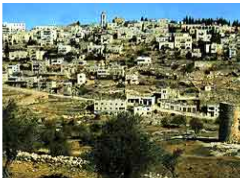
Вид города Вифлеема

Таковы библейские воспоминания, оживающие в душе христианина при виде Вифлеема и его окрестностей. Но как слабы и тусклы они пред святым воспоминанием о величайшем событии, озарившем человечество новым светом и создавшем Вифлеему истинное величие и славу,