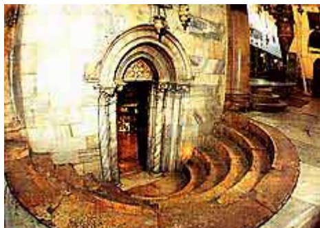
Вход в капеллу яслей

В восточной нише находится престол, а над престолом серебряная звезда с надписью на земле по латински: «Hic de Virgine Maria Iesus Christus natus est» («Здесь от Девы Марии родился Христос»). Без благоговейного трепета и духовного восторга нельзя