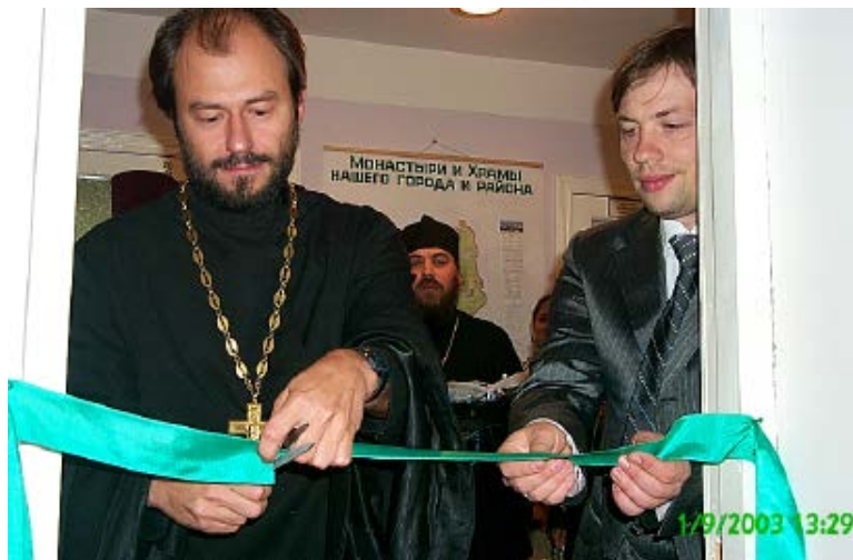
Торжественное открытие музея преподобного Сергия Радонежского

Гимназию я не узнала. Море красных, синих, белых шаров. Два залитых солнцем огромных павильона заняли чуть ли не весь гимназический участок и закрыли собой часть здания. В первом стояла оборудованная сцена. Бегали какие-то незнакомые люди и то и дело простукивали микрофон, а в другом, возле накрытых столов с гимназистами и гостями, суетились незнакомые официанты. Говорили, будто эти павильоны работали на авиасалоне в Жуковском. У гимназистов даже улучшился и без того отменный аппетит, когда узнали, что на салоне здесь обедал президент В.В. Путин. Столы немедленно подверглись «мамаеву» опустошению.